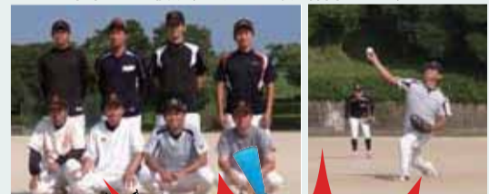
▲来年こそは優勝するために毎週練習してます!