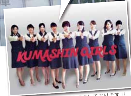
▲KUMASHIN GIRLSもお待ちしております!!