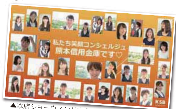
▲本店ショーウィンドウのパネルです。見に来てくださいね!