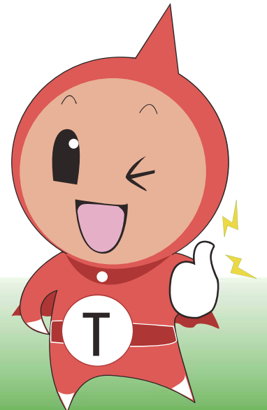
eLTAXイメージキャラクター: エルレンジャー