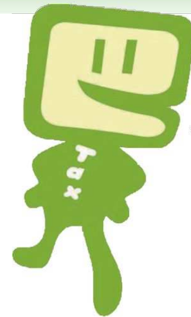
国税庁e-Taxキャラクター: イータ君