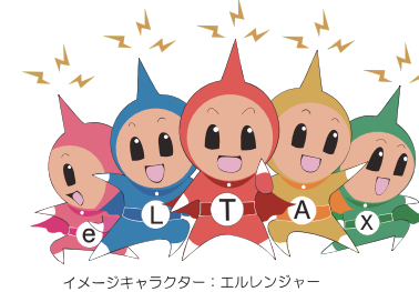
イメージキャラクター：エルレンジャー

納付書に「eL マーク」があれば、 地方税お支払サイトやスマホ決済アプリが利用できます。